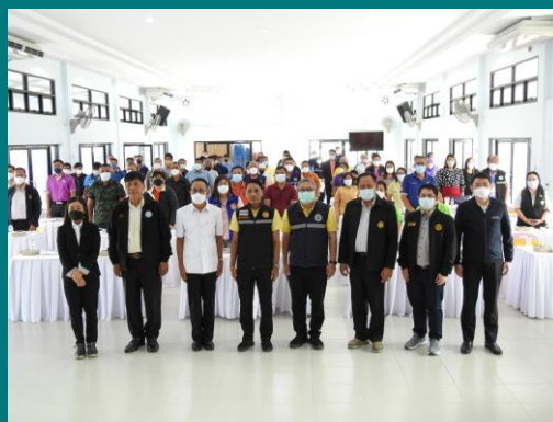
ผู้เข้าร่วมประชุมถ่ายภาพร่วมกัน นิทรรศการ