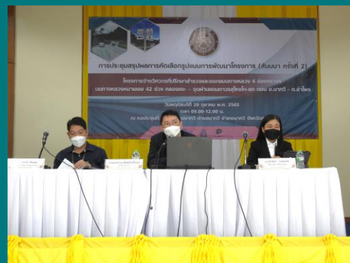
วิทยากรบรรยายรายละเอียดโครงการ