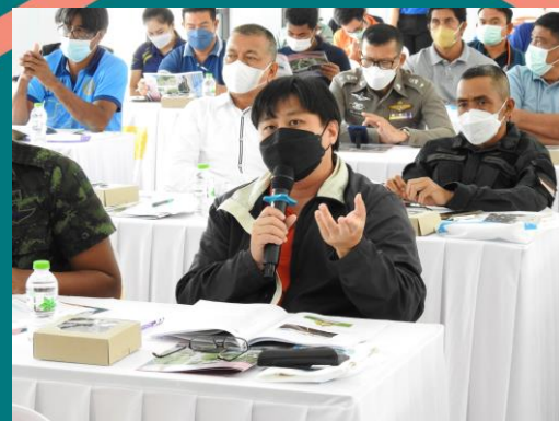
ผู้เข้าร่วมประชุมแสดงความคิดเห็น