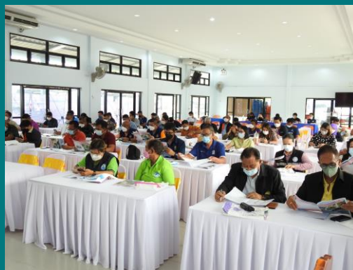
ผู้เข้าร่วมประชุมรับฟังรายละเอียดโครงการ