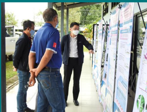
ผู้เข้าร่วมประชุมรับชมบอร์ดนิทรรศการ